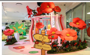
라운드랩 x 아무로키 (캐릭터)