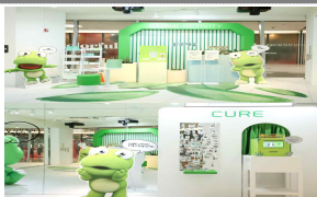
김정문말로에 x 크크롱 (캐릭터)